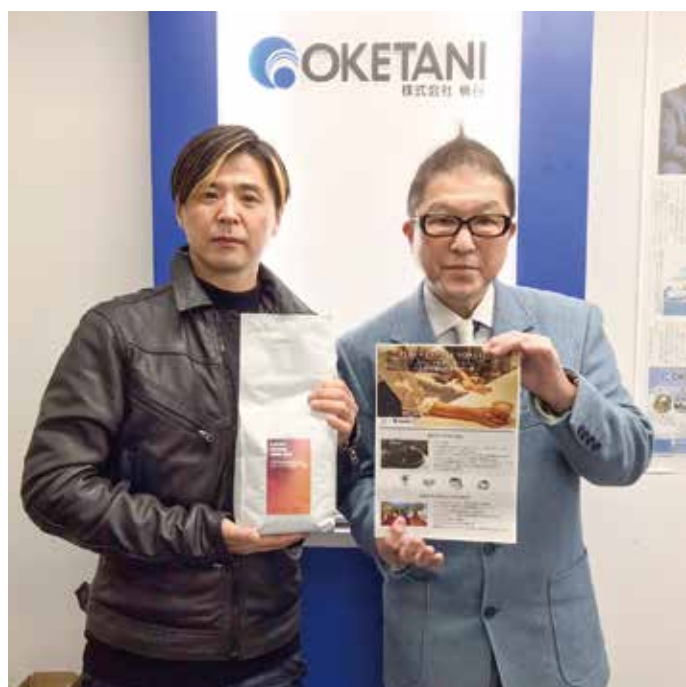
▲TERRA COFFEE ROASTERS ▲株式会社桶谷 大阪営業本部 係長 西村社長 北後

昨年の弊社の展示会で皆さんを「アツと！」驚かせた「桶谷冷凍食品ブース」。次は「なんと！」と驚かせる第2弾です。